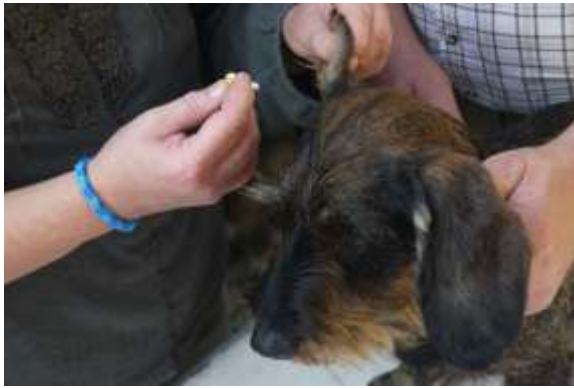
D'abord une petite piqûre dans l'oreille...

... pour récolter une petite goutte de sang ! Un peu moins zen, le Elvis !