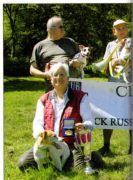
Grâce à Fitou, le Club du jack Russell terrier remporte cette Coupe de France de broussaillage et s'est porté volontaire pour organiser la prochaine en 2017.